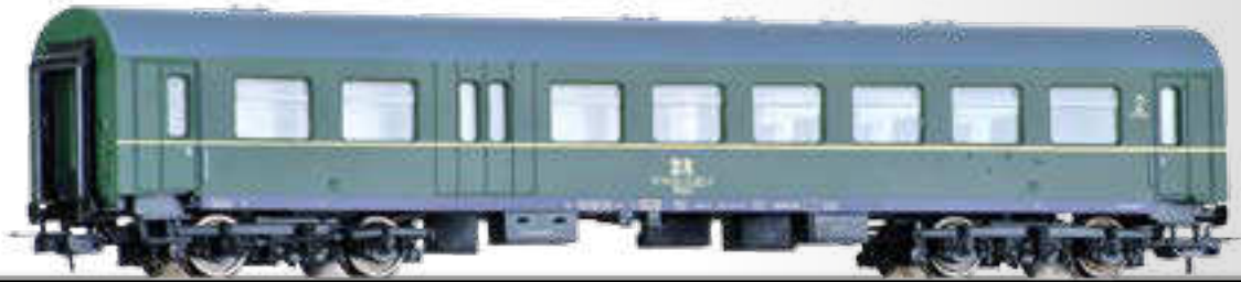
Reisezugwagen 2. Klasse mit Gepäckabteil BDghwse der DR 2nd class passenger coach with baggage compartment BDghwse of the DR