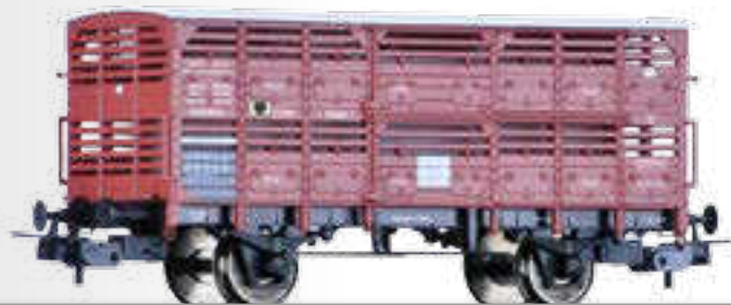
Verschlagwagen der K.P.E.V. Shed car for transport of animals of the K.P.E.V.