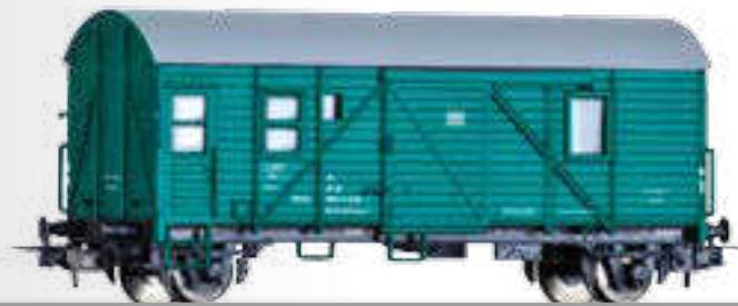
Bahndienst-Werkstattwagen der DB Maintenance car of the DB