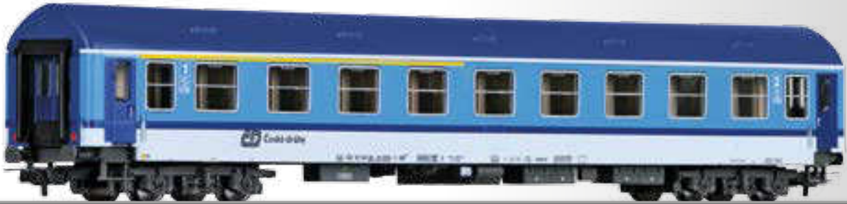
Reisezugwagen 1./2. Klasse, Typ Y/B 70, der ČD 1st/2nd class passenger coach, type Y/B 70, of the ČD