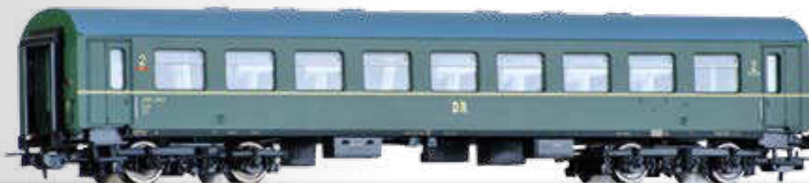
Reisezugwagen 2. Klasse B4ge der DR 2nd class passenger coach B4ge of the DR