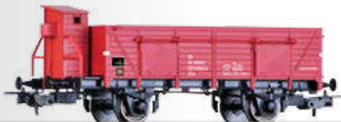
Offener Güterwagen Elmo der GySEV Open car Elmo of the GySEV