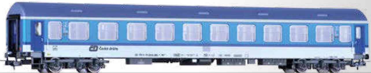
Reisezugwagen 2. Klasse mit Fahrradabteil, Typ Y/B 70, der ČD 2nd class passenger coach with bicycle compartment, type Y/B 70, of the ČD