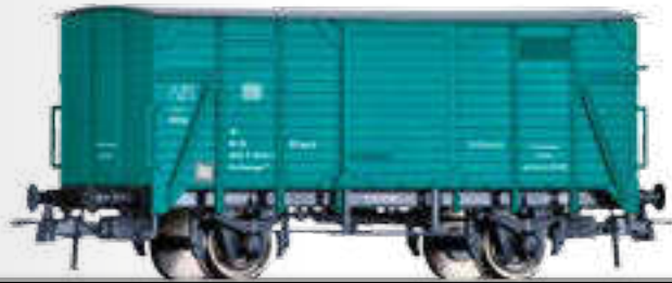
Bahndienst-Gerätewagen der DB Service car of the DB