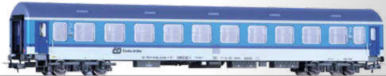
Reisezugwagen 2. Klasse, Typ Y/B 70, der ČD 2nd class passenger coach, type Y/B 70, of the ČD