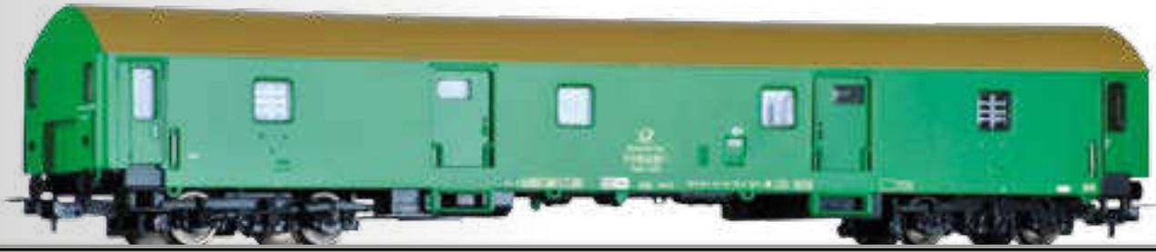
Bahnpostwagen Post me-bl/24,2, Typ Y, der Deutschen Post (1:100) Mail waggon Post me-bl/24,2, type Y, of the Deutschen Bundespost (1:100)