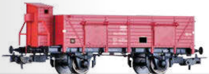
Offener Güterwagen Kzn der MAV Open car Kzn of the MAV