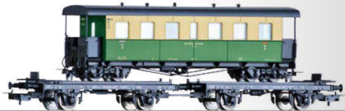
Set „Schmalspurtransport“ der DB, bestehend aus zwei Transportwagen H0 beladen mit einem H0e Personenwagen der NKB Set "Narrow gauge transport" of the DB with two transport cars H0 loaded with one narrow gauge passenger coach H0e of the NKB