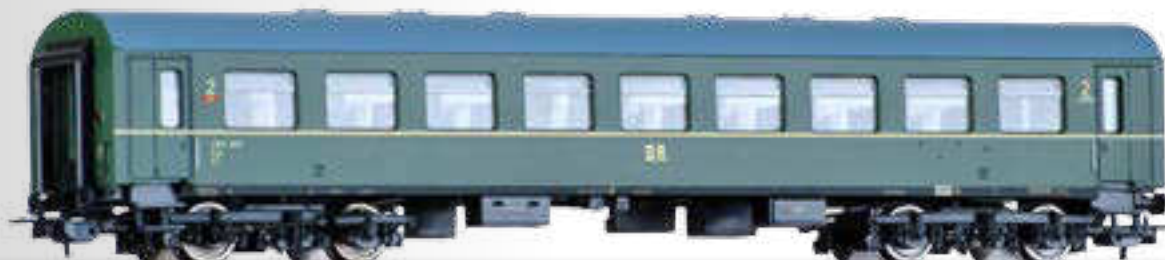
Reisezugwagen 2. Klasse B4ge der DR, 2. Betriebsnummer 2nd class passenger coach B4ge of the DR, 2nd operation number