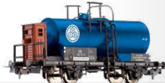
Kesselwagen „Ölwerke J. Schindler“, eingestellt bei der DB Tank car "Ölwerke J. Schindler" of the DB