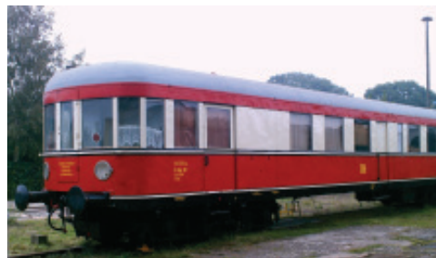
VB 147 551a/b Epoche IV, DR