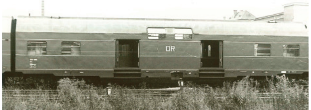
Epoche III, DR, Art.-Nr. 1961